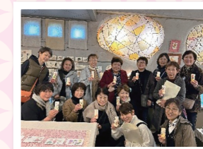
桜江町紙すき体験ミニ照明作成

斐川町の皆様には、「大しめなわ創作館」にて、しめ縄づくりを体験して頂き、「加田の湯」でランチ、その後、「赤来高原観光りんご園」でのりんご狩りの予定でしたが、あいにく雨が降り、選果場でのお買い物になってしまったのが残念でした。