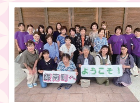
斐川町商工会女性部の受入

新年あけましておめでとうございます。 本年も女性部活動に、ご理解ご協力の程、よろしく申し上げます。 昨年は、5月のぼたんまつりのイベントや7月のとんぼらふる里夏祭りに参画し、9月には、おもてなし交流事業として、斐川町商工会女性部の皆様の受け入れを行いました。