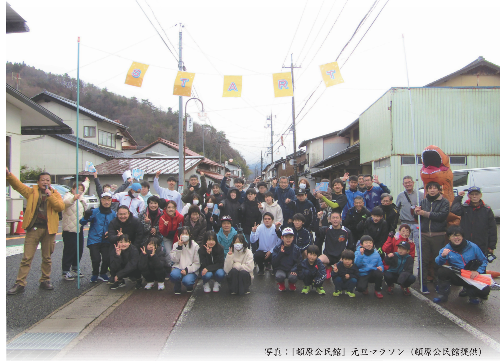
写真：「頓原公民館」元旦マラソン

〒690-3207 島根県飯石郡飯南町頓原2212-3 TEL(0854)72-0907 FAX(0854)72-1239